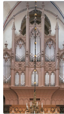
Buchholz-Organ St. Nikolai

2004 – 2008 Restaurierung durch Orgelwerkstatt Kristian Wegscheider, Hans van Rossum, Gunter Böhme