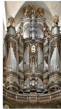
Jakobi-Organ St. Jakobi

2003 – 2006 Restaurierung durch Orgelwerkstatt Kristian Wegscheider, Johannes Klais Orgelbau