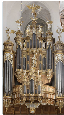
Stellwagen-Organ St. Marien

Es ist wieder soweit: die 3. Stralsunder Orgeltage werden im September 2024 viele Musikfreunde nach Stralsund locken. Alle zwei Jahre präsentiert die „Orgelstadt Stralsund“ ihre monumentalen Instrumente in dichter Folge innerhalb einer Woche. Und auch in diesem Jahr wird bei den 17 Konzerten und Veranstaltungen für jeden Geschmack etwas dabei sein: von Alter Musik bis zum Jazz, vom Kinderkonzert bis zum Stummfilm werden viele Facetten der „Königin der Instrumente“ zu erleben sein. Auch die fast schon legendäre Orgelnacht, die sich inzwischen jährlich etabliert hat, wird natürlich nicht fehlen: drei besondere Konzerte an einem Abend, bei denen das Publikum von einer Kirche zur nächsten wandelt und so alle drei großen Orgeln direkt nacheinander zu hören bekommt. Die Kirchengemeinden St. Nikolai und St. Marien, die Kulturkirche St. Jakobi und das Kreisdiakonische Werk Stralsund e.V. sowie die Hansestadt Stralsund laden zu einer Woche voller Musik und Freude während der 3. Stralsunder Orgeltage!